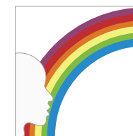
LA RICERCA Associazione onlus

Responsabile Settore Famiglie Associazione "La Ricerca" Onlus www.laricerca.net prevenzione@laricerca.net Stradone Farnese, 96 (PC) TEL. 0523/338710